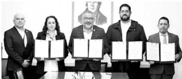
Es firmado el Protocolo de Seguridad para Candidatos en el Proceso Electoral 2024.

por los titulares de la Secretaría General de Gobierno (SGG) y la Secretaría de Seguridad del Estado de