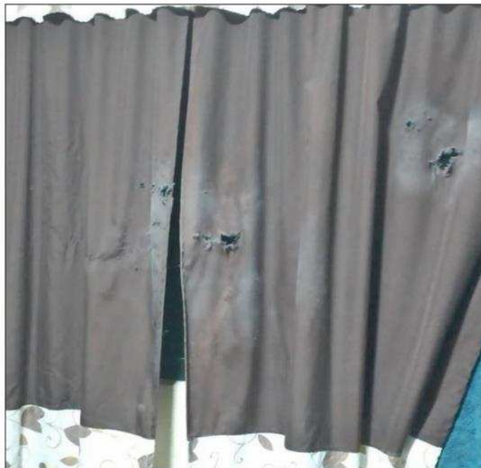
◀ Las cortinas del inmueble muestran los impactos de las balas.

Asimismo, llamó a las autoridades para que garanticen un proceso electoral en paz para los ciudadanos y de seguridad para todos los candidatos y candidatas de todas las expresiones políticas.