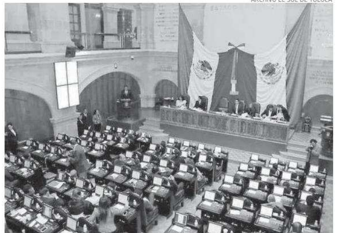
Serán 50 las y los diputados titulares que se ausentarán de la Legislatura