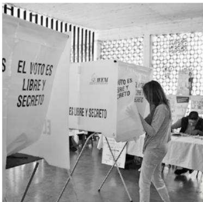
La elección del próximo 2 de junio, abarcará mil 300 cargos entre diputaciones locales y ayuntamientos.

Los postulantes deben presentar documentación requerida ante el IEEM, incluyendo para pueblos y comunidades indígenas la carta de autoadscripción indígena y la constancia de adscripción indígena, y para personas con discapacidad, un certificado médico expedido por una institución de salud pública. Para la población LGBTQ+, se deben presentar declaraciones de pertenencia a la comunidad y documentos que respalden dicha identidad.